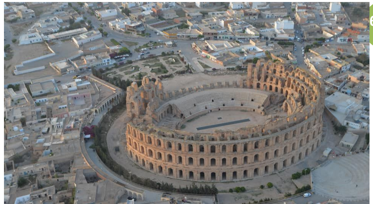
Arènes romaines de Mahrès (gouvernorat de Sfax). Exceptionnellement, on ne dira rien concernant l'altitude de survol de la ville... Certainement un effet de zoom de l'appareil photo...