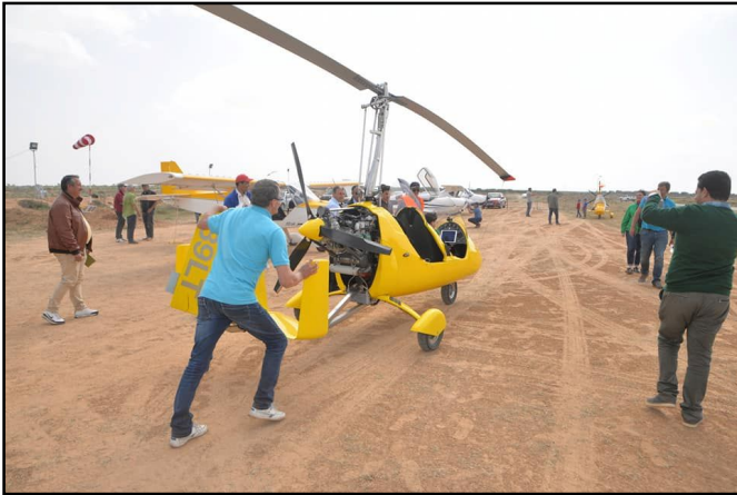
Terrain de Jammel Monastir ou le photographe photographié...

D'autant que le vol promet d'être fort agréable puisque empruntant la vallée du Rhône, la basse Provence avec traversée de la Méditerranée depuis La Mole, la Corse puis la Sardaigne dont les lectures de voyages aériens que l'on peut consulter sur Internet ne peuvent guère laisser indifférent !.. C'est même impossible... Toutefois, la qualification en langue anglaise est obligatoire, sauf à maîtriser l'italien. En effet et sur ce point, jusqu'en Corse il n'y a pas de difficulté, pas plus lors de l'arrivée en Tunisie mais entre les deux se trouvent les TMA sardes qu'il n'est guère possible d'éviter, initiative qui serait d'ailleurs bien peu prudente et totalement sans intérêt. D'autant comme souligné ci-dessus, que les comptes-rendus de voyages (cf. internet) montrent déjà que le simple déplacement jusque là en vaut largement la peine.